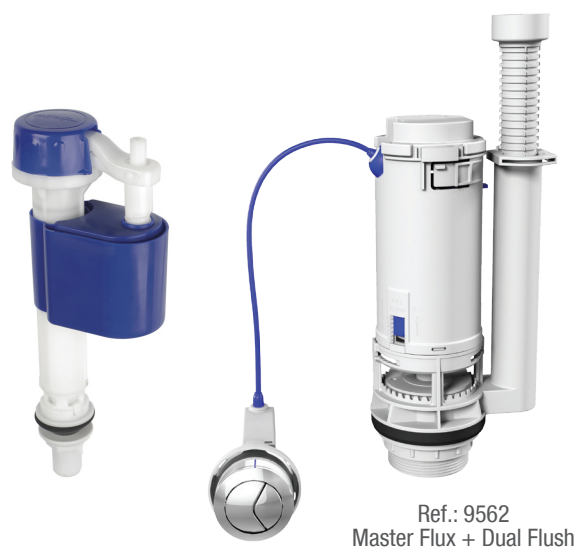
Ref.: 9562 Master Flux + Dual Flush

Os kits completos da Censi foram pensados buscando atender todas as necessidades do mercado. Suportam alta e baixa pressão, economizam até 50% de água e podem ser instalados em qualquer modelo de caixa acoplada.