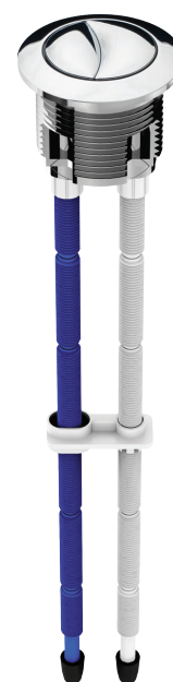
Ref.: 9546 Modelo Roca