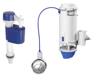
Ref.: 9504 Master Flux + Conversor Dual Flush