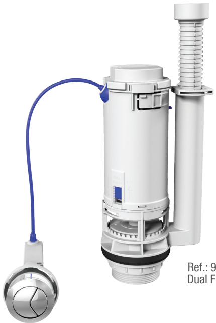
Ref.: 9555 Dual Flush

Com sistema de descarga completa e parcial, os mecanismos Dual Flush são indicados para todos os modelos de caixas acopladas, possibilitam até 50% de economia de água e acompanham acionador.