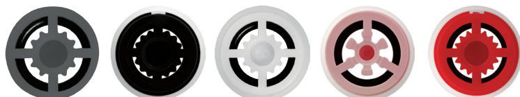
Ref.: 9578 4 L/min