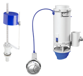
Ref.: 9502 Pop Flux + Conversor Dual Flush