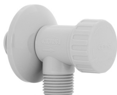
Ref.: 9596 Cinza

Os registros reguladores da Censi são 3 em 1, pois possuem registro, regulador e filtro em um só produto. Possibilitam grande economia de água e facilitam a manutenção em torneiras e caixas acopladas.