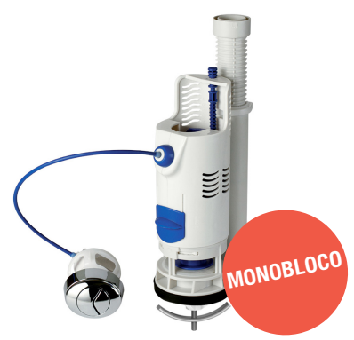
Ref.: 9590 Hidro Smart