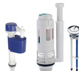
Ref.: 9509 Master Flux + Roca

*: exceto no Conversor Dual Flush, que não necessita destes itens na instalação.