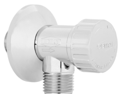
Ref.: 9595 Cromado