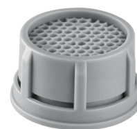
Ref.: 4660 Filtro com restritor de vazão para arejador