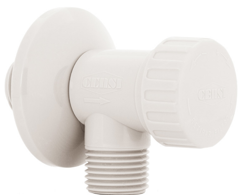
Ref.: 9594 Branco