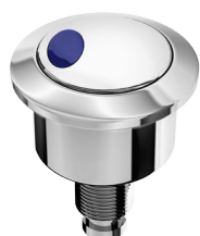
Ref.: 9511 Modelo Deca

Compatíveis com diversos modelos de mecanismos do mercado, os acionadores Censi podem ser instalados em qualquer modelo de caixa acoplada (lateral, frontal e superior) e são produzidos em plástico de engenharia (ABS) com acabamento cromado.