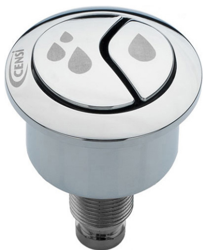
Ref.: 9564 Modelo Censi

Compatíveis com diversos modelos de mecanismos do mercado, os acionadores Censi podem ser instalados em qualquer modelo de caixa acoplada (lateral, frontal e superior) e são produzidos em plástico de engenharia (ABS) com acabamento cromado.