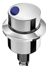
Ref.: 9536 Modelo Deca Saliente