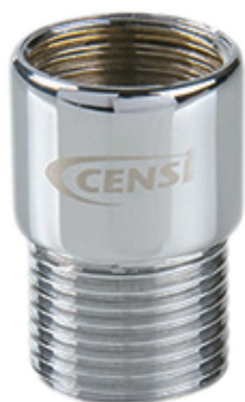
Ref.: 9577 Kit de Restritores com Adaptador de Latão