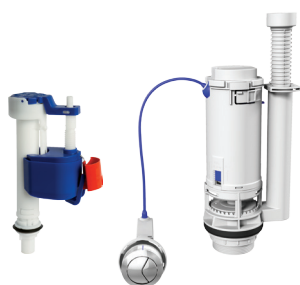
Ref.: 9545 Leak Lock + Dual Flush