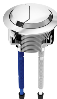
Ref.: 9522 Modelo Eternit